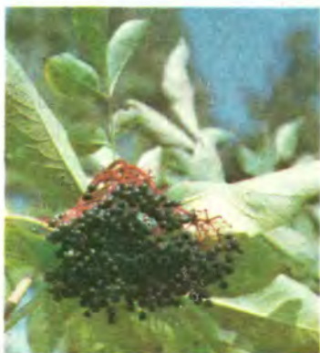
940. Бузина чорна.